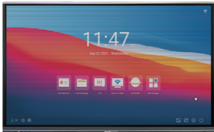
senza tecnologia Flicker-Free

La tecnologia Flicker-free elimina lo sfarfallio a qualsiasi livello di luminosità e riduce efficacemente l'affaticamento degli occhi . I normali monitor LCD sfarfallano 200 volte al secondo.