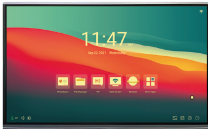
con tecnologia Low Blue Light