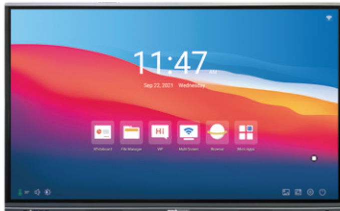
con tecnologia Flicker-Free