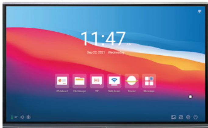
senza tecnologia Low Blue Light

La tecnologia Low Blue Light si occupa di ridurre la quantità di frequenze blu e viola emesse dal pannello del monitor , riducendo la possibilità che un individuo, dopo lungo tempo trascorso davanti ad esso, non riscontri emicrania, disturbi del sonno, danni agli occhi e tensioni.